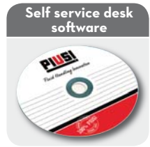
Self service desk software