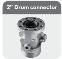
2" Drum connector