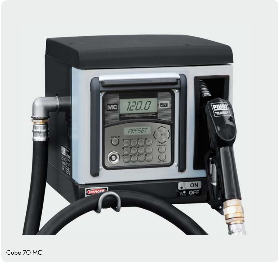
Cube 70 MC