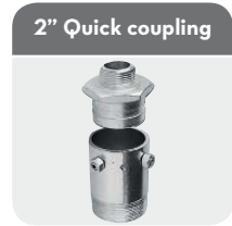
2" Quick coupling