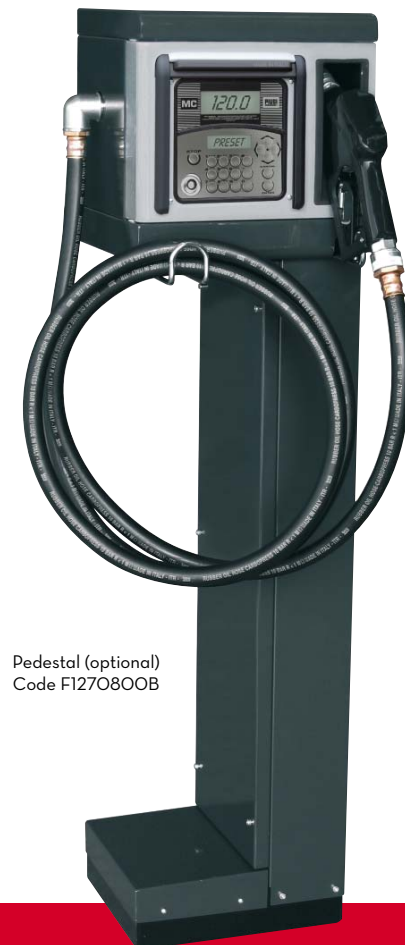
Pedestal (optional) Code F1270800B