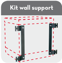
Kit wall support