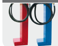
RED Code F1093640B BLEU Code F1093600B