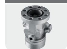
with integrated valve Code F17163000