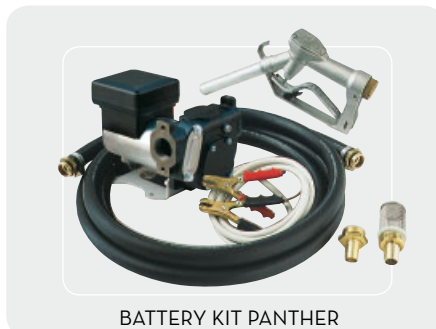
BATTERY KIT PANTHER