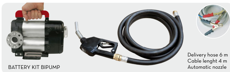
BATTERY KIT BIPUMP

Delivery hose 6 m Cable lenght 4 m Automatic nozzle