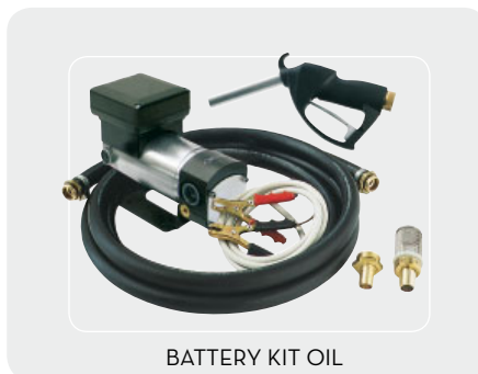
BATTERY KIT OIL