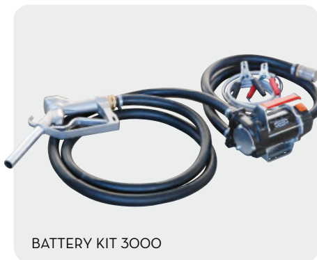
BATTERY KIT 3000